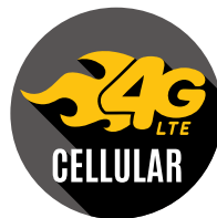
DKS Cellular Option™

El servicio DKS VoIP ** brinda comunicación de voz fiable y programación llave en mano a través de su conexión a Internet.