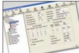
fácil de navegar interfaz visual