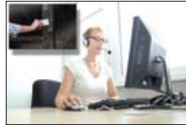
reportando la actividad del acontecimiento