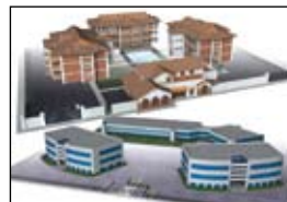
residencial y comercial